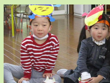
鬼さんいなくなってホッ