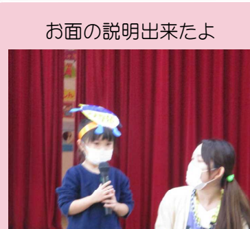
お面の説明出来たよ