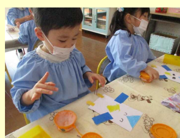
のりも上手に出来るよ