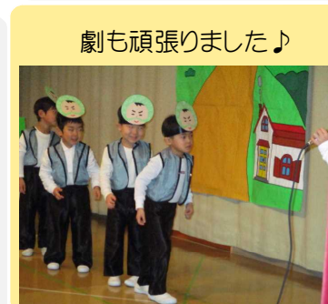
劇も頑張りました♪