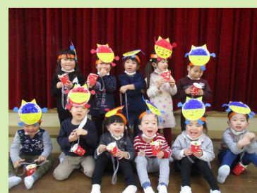
鬼退治出来ました！