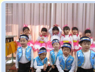
発表会楽しかった★