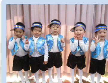
かっこよくピース！