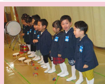
歌も元気いっぱい