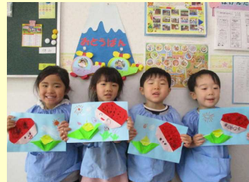
かわいく出来ました！