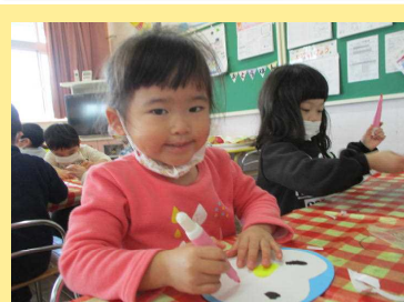
にっこりお口にしよう