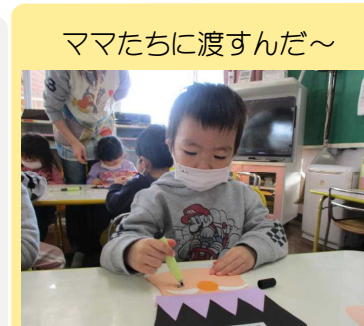
ママたちに渡すんだ～