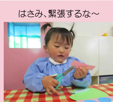
はさみ、緊張するな～