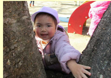
せんせい、みつけた！