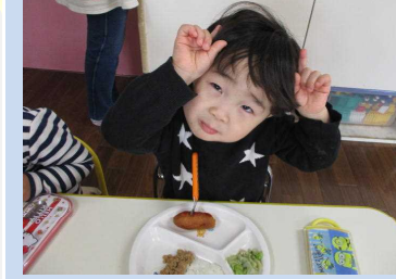
ご飯が鬼さんだったよ◎