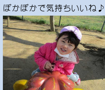
ぽかぽかで気持ちいいね♪