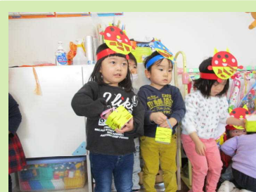
こわい…けどやるぞ！