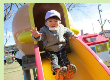
風みたいにぴゅーん！