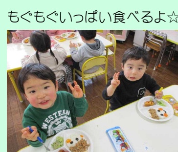
もぐもぐいっぱい食べるよ☆