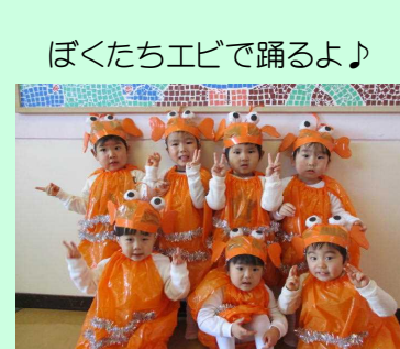
ぼくたちエビで踊るよ♪