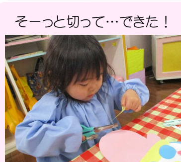
そーっと切って…できた！