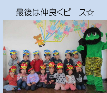
最後は仲良くピース☆