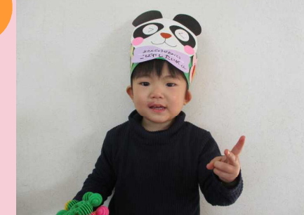
ニコニコ笑顔が素敵な3歳☆

今月は生活発表会が行われました。子どもたちの緊張はもちろん、見守る保護者の皆さんもドキドキしたのではないのでしょうか？本番では練習しながら上手な演技を見せてくれた子ども達には感動しました。