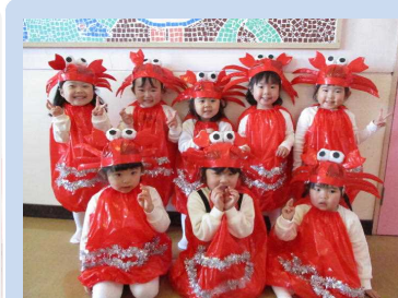
キュートなカニさん達♡